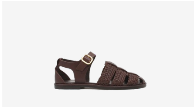
CUIR LISSE TRESSÉ MARRON