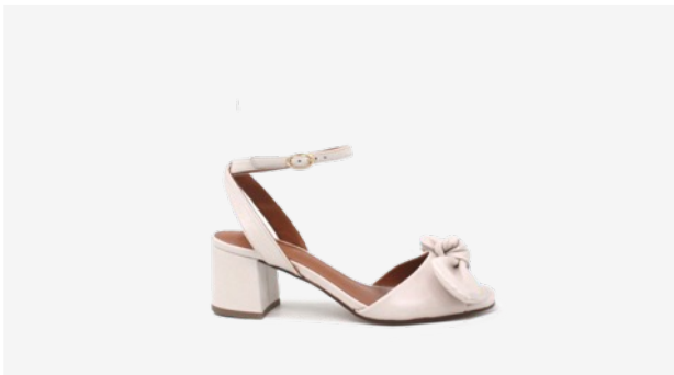
CUIR LISSE BEIGE