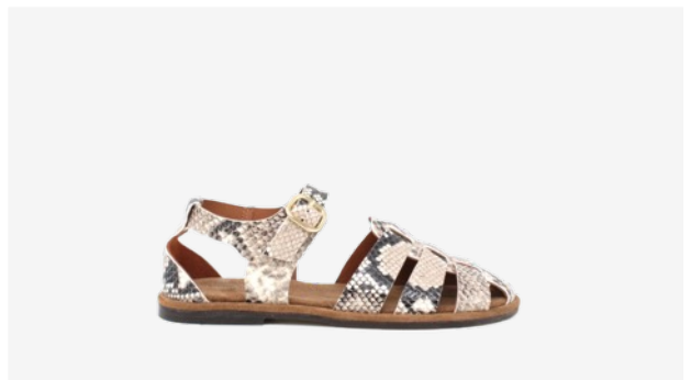
CUIR FAÇON PYTHON BEIGE