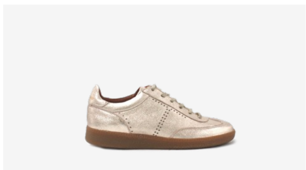
CUIR PAILLETÉ DORÉ CLAIR