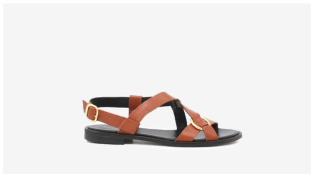
CUIR LISSE CAMEL