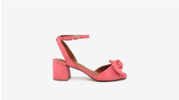
CUIR VELOURS ROSE