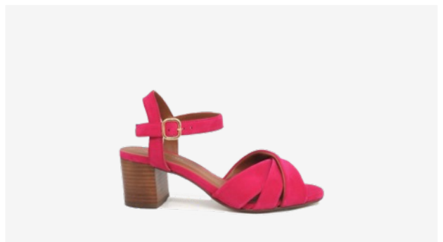
CUIR VELOURS FUCHSIA