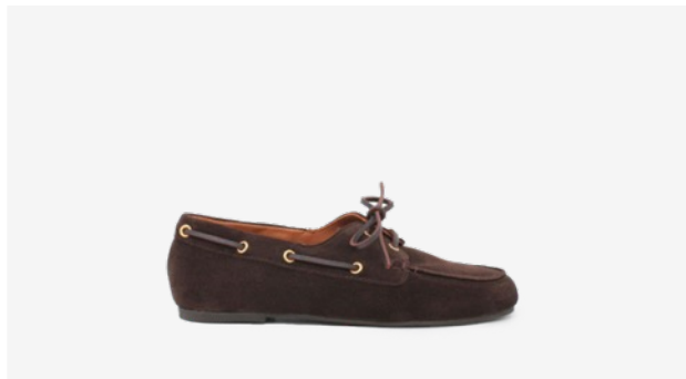
CUIR VELOURS MARRON