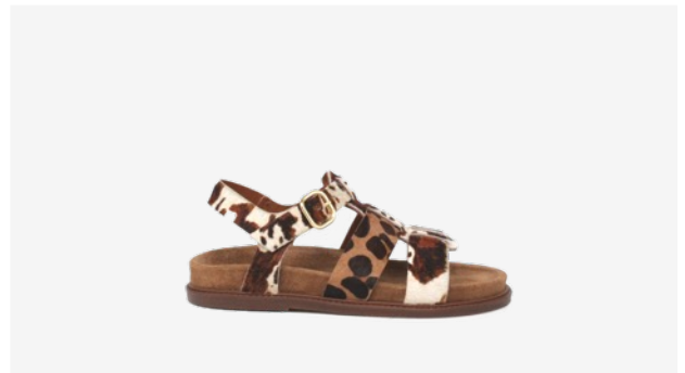
CUIR FAÇON POULAIN VACHE / LÉO