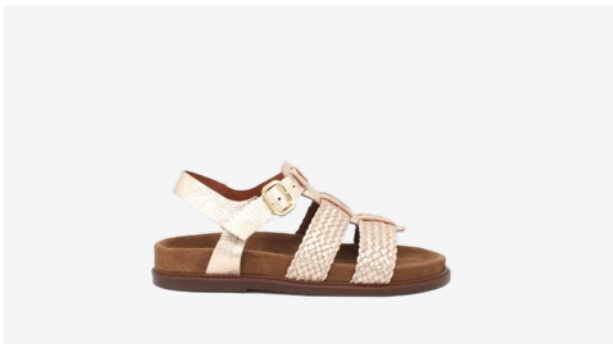
CUIR PAILLETÉ DORÉ CLAIR