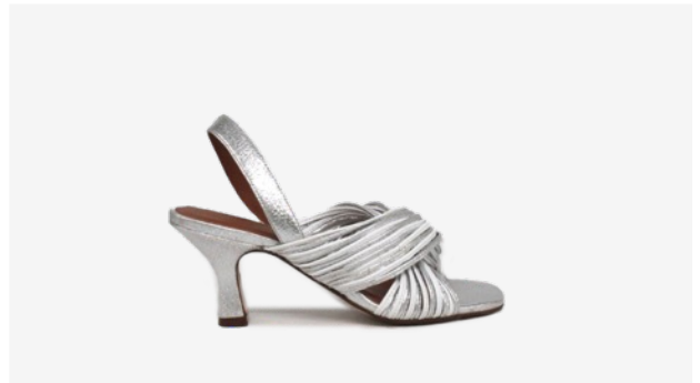
CUIR PAILLETÉ ARGENT