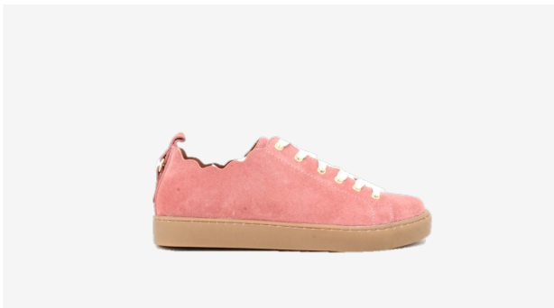
CUIR VELOURS ROSE