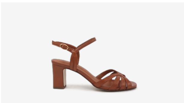
CUIR LISSE COGNAC