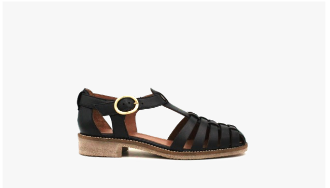
CUIR LISSE NOIR