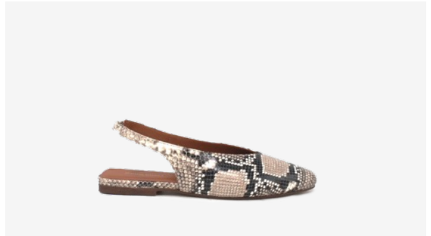
CUIR FAÇON PYTHON BEIGE