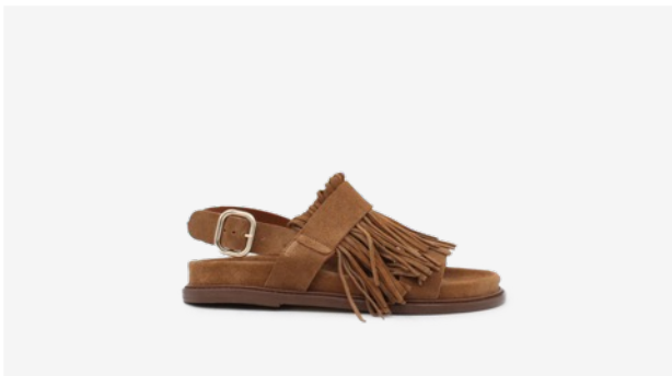
CUIR VELOURS CAMEL