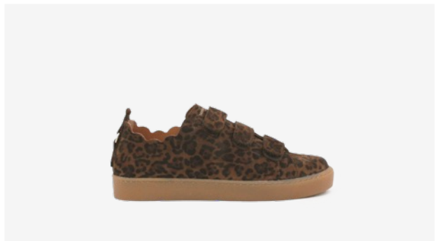
CUIR VELOURS LÉOPARD