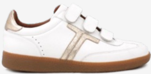
CUIR BLANC / DORÉ