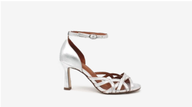
CUIR PAILLETÉ ARGENT