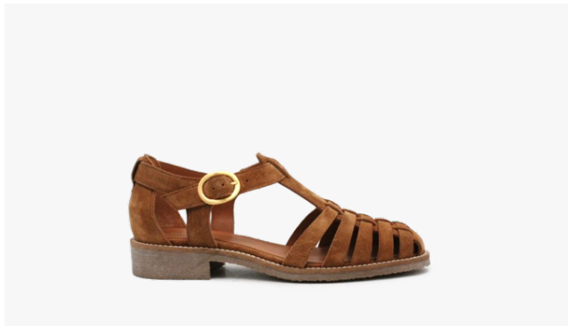
CUIR VELOURS CAMEL