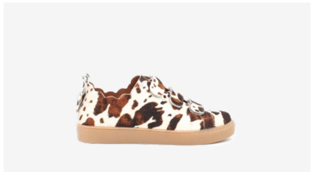
CUIR FAÇON POULAIN VACHE