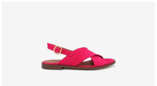
CUIR VELOURS FUCHSIA*