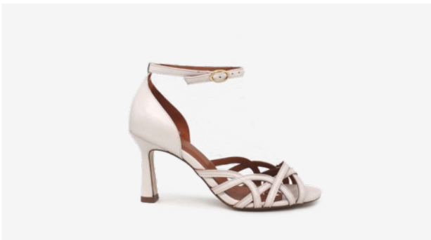
CUIR LISSE BEIGE*