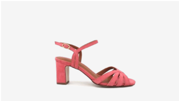
CUIR VELOURS ROSE