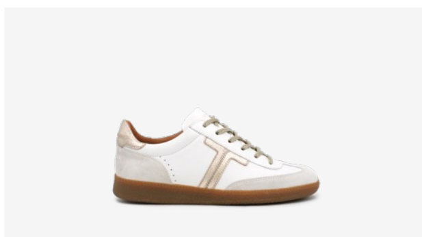
CUIR BLANC / DORÉ