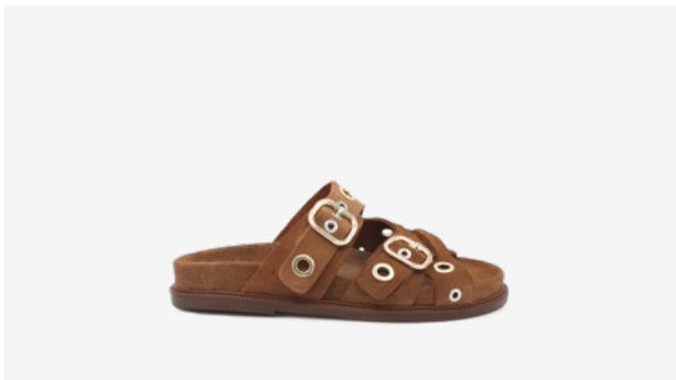
CUIR VELOURS CAMEL