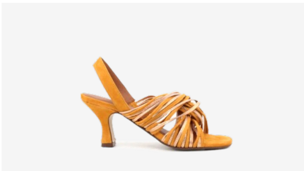
CUIR VELOURS JAUNE