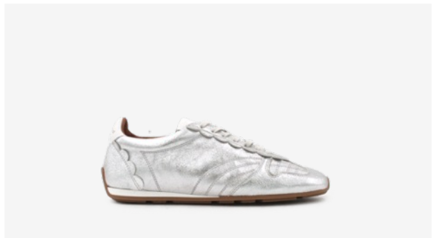
CUIR PAILLETÉ ARGENT