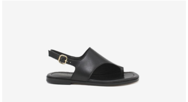
CUIR LISSE NOIR