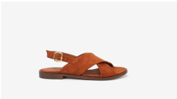
CUIR VELOURS COGNAC