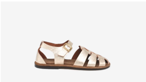
CUIR PAILLETÉ DORÉ CLAIR