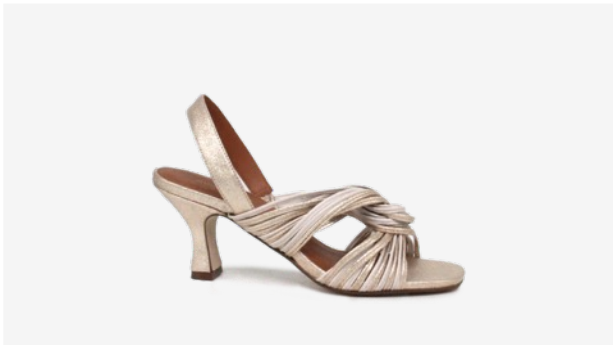
CUIR PAILLETÉ DORÉ CLAIR