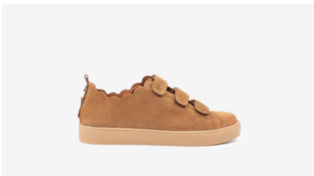
CUIR VELOURS CAMEL