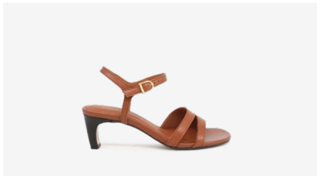
CUIR LISSE COGNAC