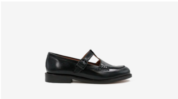
CUIR GLACÉ NOIR