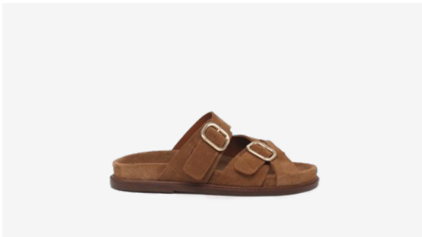
CUIR VELOURS CAMEL