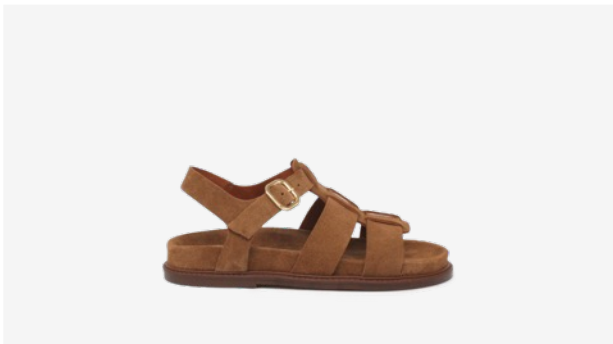
CUIR VELOURS CAMEL