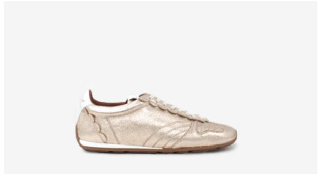
CUIR PAILLETÉ DORÉ CLAIR