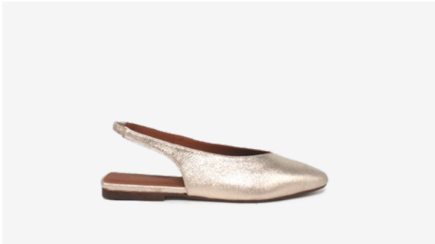
CUIR PAILLETÉ DORÉ CLAIR