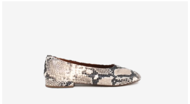
CUIR FAÇON PYTHON BEIGE