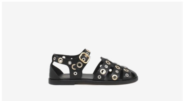
CUIR LISSE NOIR