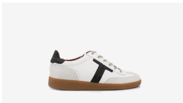
CUIR BLANC / NOIR