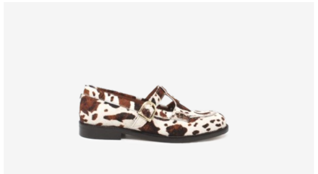
CUIR FAÇON POULAIN VACHE