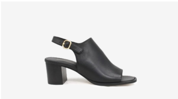
CUIR LISSE NOIR