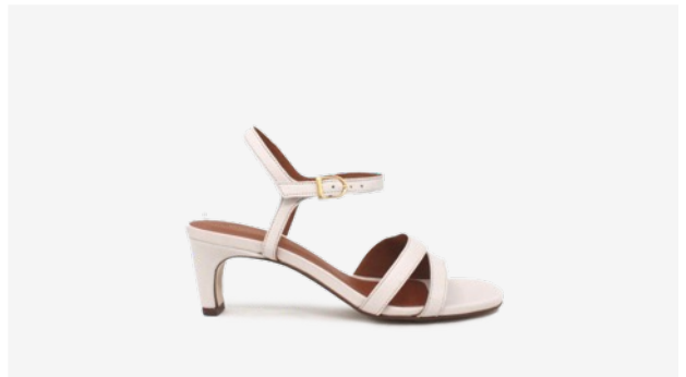
CUIR LISSE BEIGE*