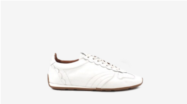
CUIR LISSE CRÈME