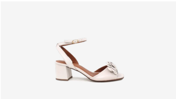
CUIR LISSE BEIGE