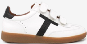
CUIR BLANC / NOIR