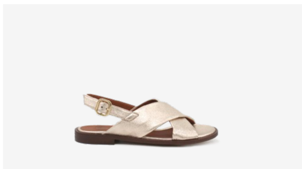
CUIR PAILLETÉ DORÉ CLAIR