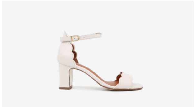
CUIR LISSE BEIGE