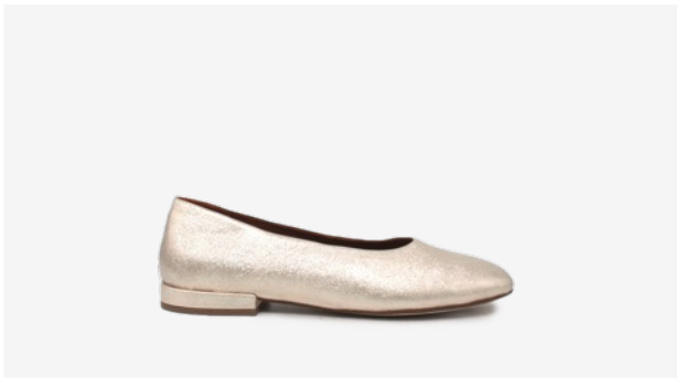
CUIR PAILLETÉ DORÉ CLAIR