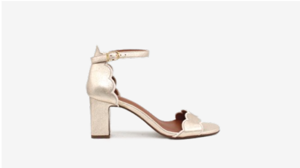
CUIR PAILLETÉ DORÉ CLAIR