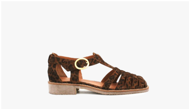
CUIR VELOURS LÉOPARD