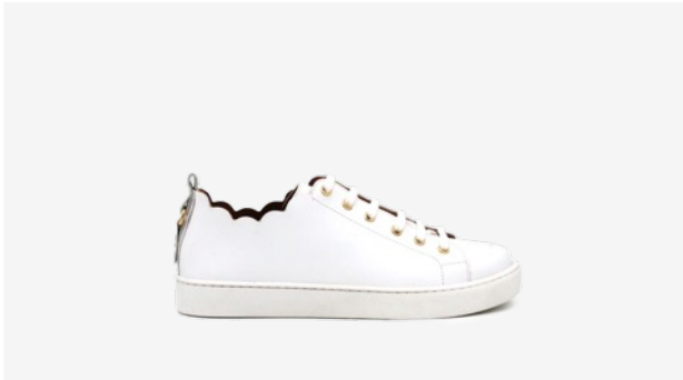
CUIR LISSE BLANC