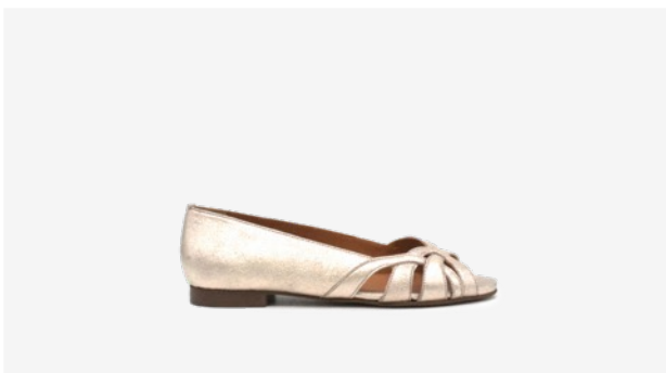
CUIR PAILLETÉ DORÉ CLAIR