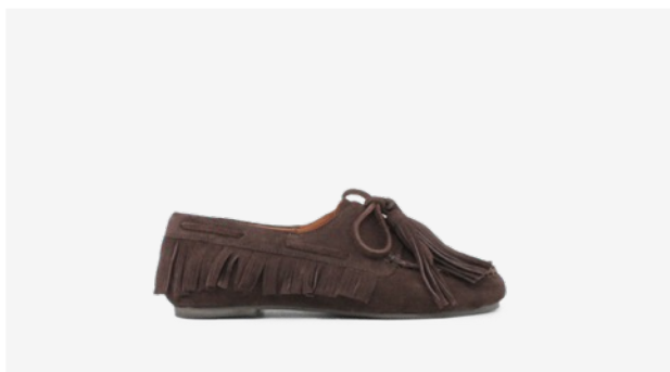
CUIR VELOURS MARRON