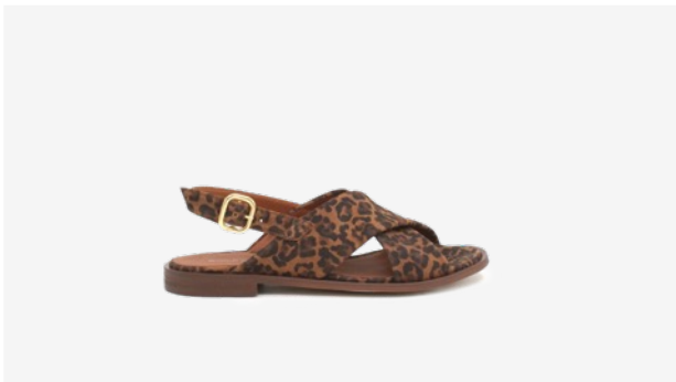
CUIR VELOURS LÉOPARD