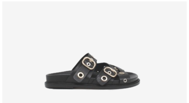
CUIR LISSE NOIR