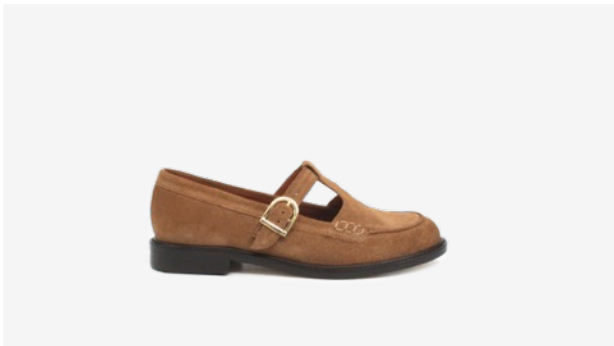
CUIR VELOURS CAMEL