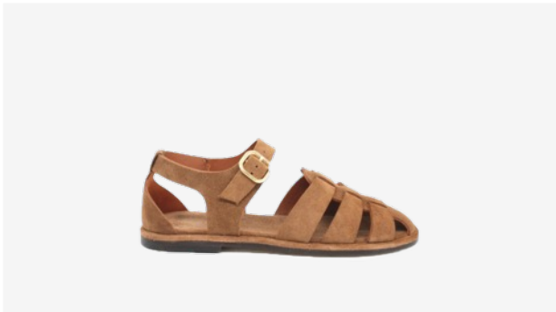
CUIR VELOURS TAUPE