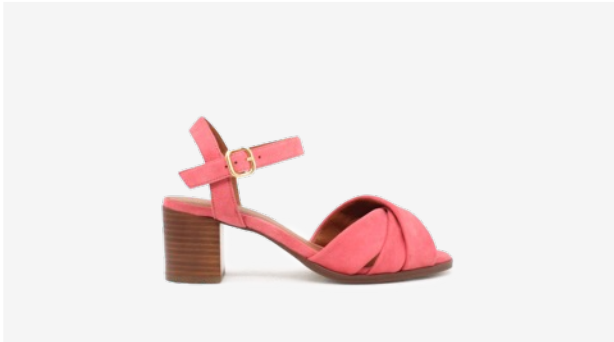
CUIR VELOURS ROSE