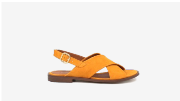
CUIR VELOURS JAUNE