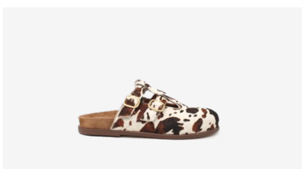
CUIR FAÇON POULAIN VACHE