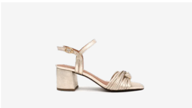
CUIR PAILLETÉ DORÉ CLAIR