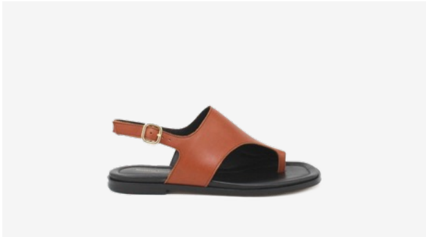
CUIR LISSE CAMEL