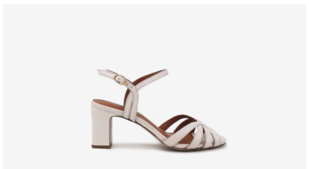
CUIR LISSE BEIGE*