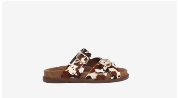
CUIR FAÇON POULAIN VACHE