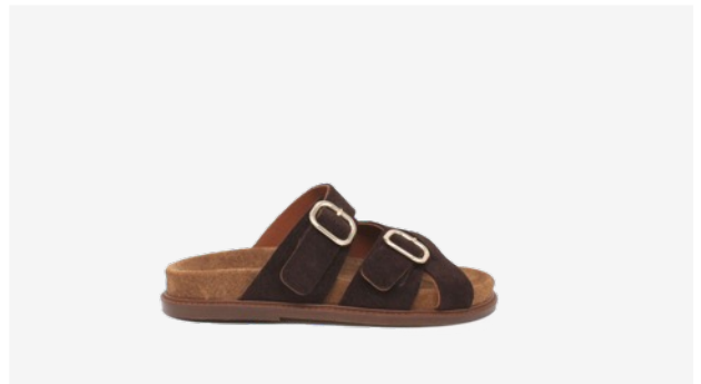
CUIR VELOURS MARRON