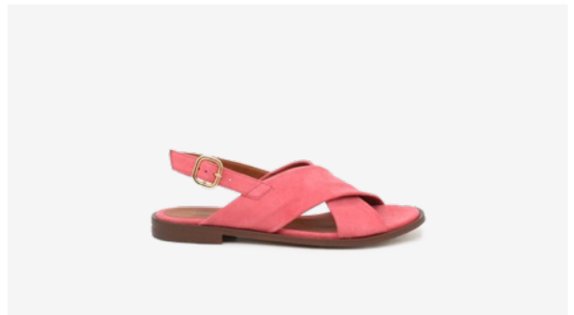
CUIR VELOURS ROSE