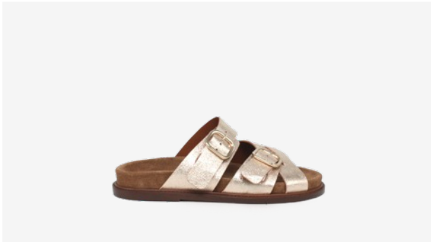
CUIR PAILLETÉ DORÉ CLAIR