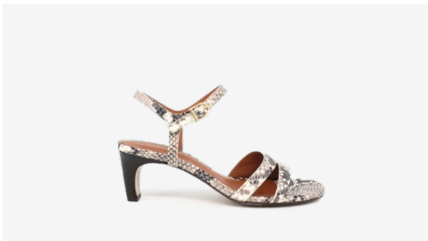
CUIR FAÇON PYTHON BEIGE