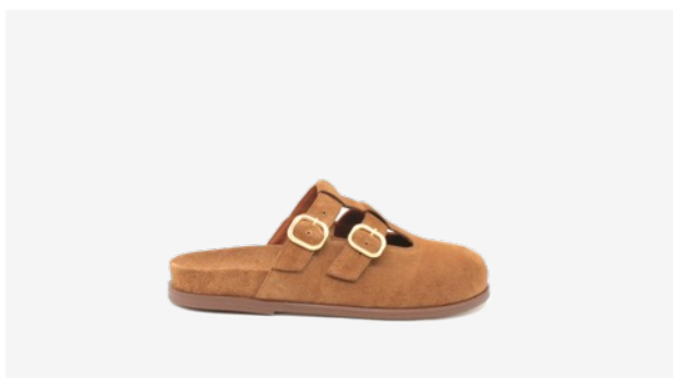
CUIR VELOURS CAMEL