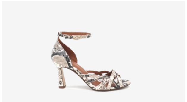
CUIR FAÇON PYTHON BEIGE