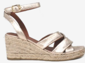
CUIR PAILLETÉ DORÉ CLAIR