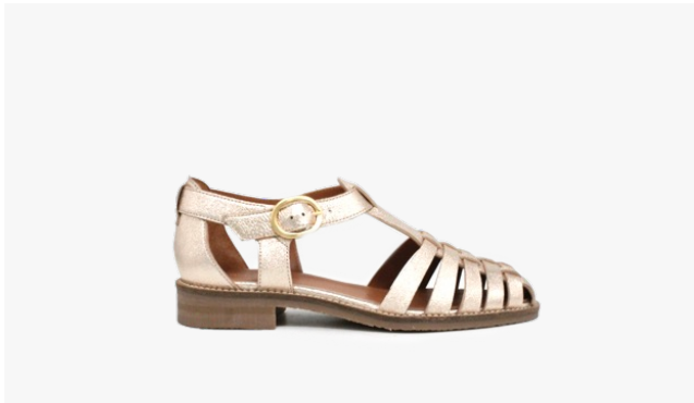
CUIR PAILLETÉ DORÉ CLAIR