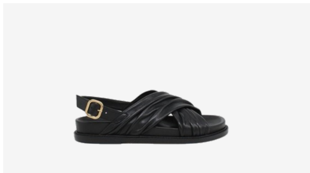
CUIR LISSE NOIR