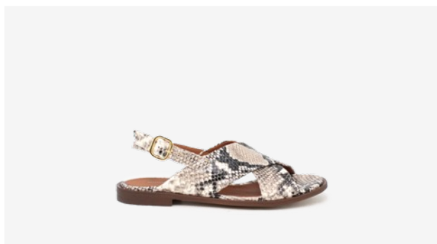
CUIR FAÇON PYTHON BEIGE