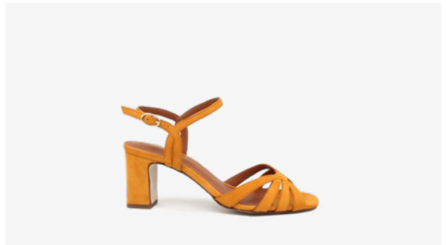
CUIR VELOURS JAUNE