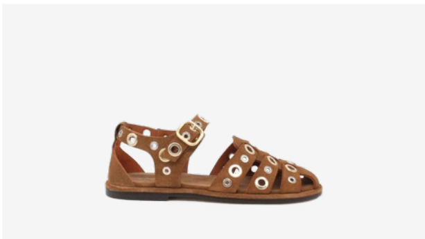
CUIR VELOURS CAMEL