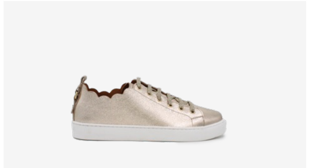
CUIR PAILLETÉ DORÉ CLAIR