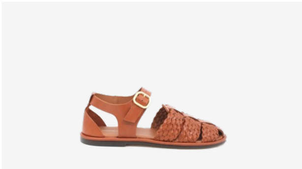
CUIR LISSE TRESSÉ CAMEL