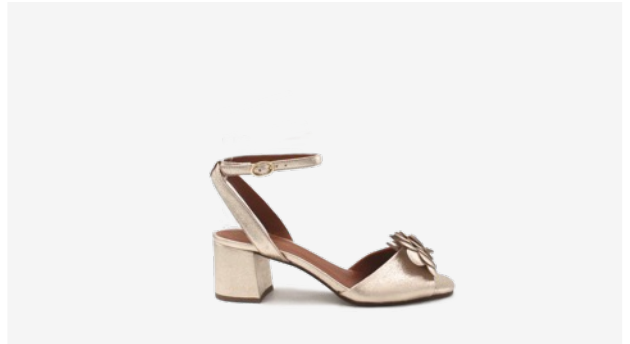
CUIR PAILLETÉ DORÉ CLAIR