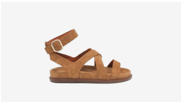
CUIR VELOURS CAMEL