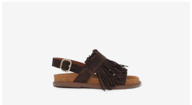
CUIR VELOURS MARRON