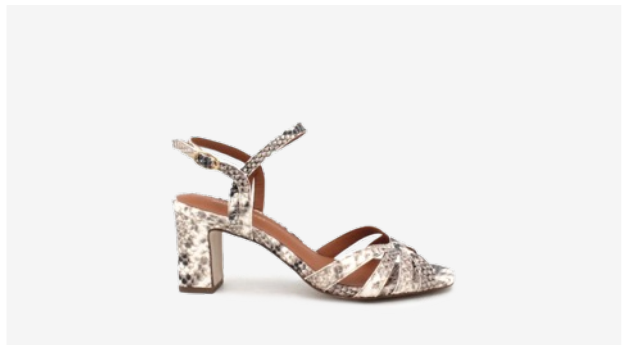
CUIR FAÇON PYTHON BEIGE