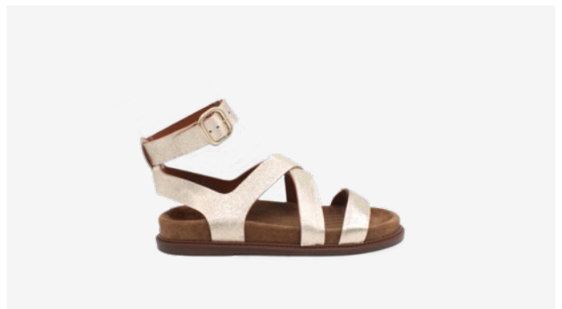
CUIR PAILLETÉ DORÉ CLAIR