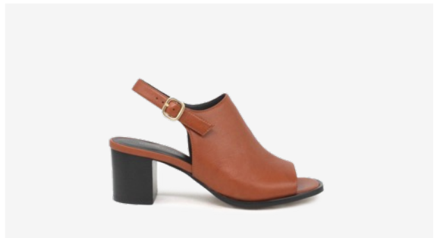
CUIR LISSE COGNAC