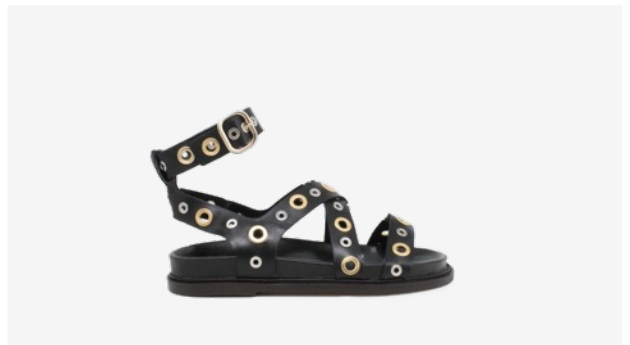
CUIR LISSE NOIR