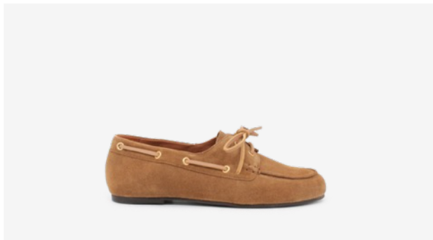
CUIR VELOURS CAMEL