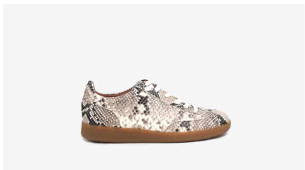
CUIR FAÇON PYTHON BEIGE