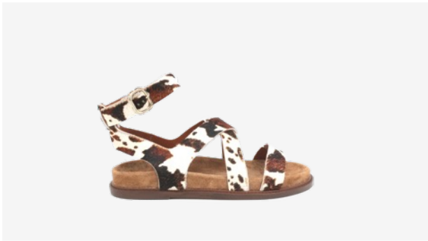
CUIR FAÇON POULAIN VACHE