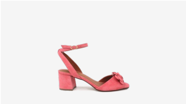
CUIR VELOURS ROSE