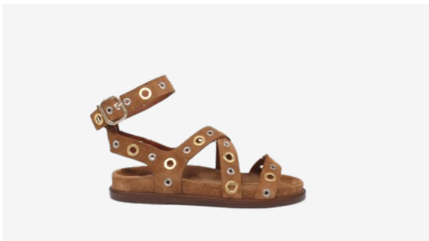
CUIR VELOURS CAMEL