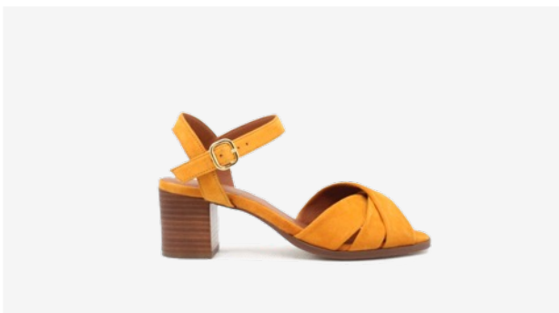
CUIR VELOURS JAUNE