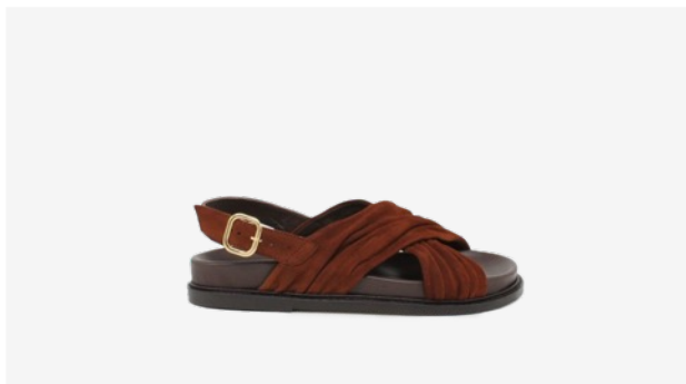
CUIR VELOURS CAMEL