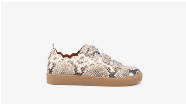
CUIR FAÇON PYTHON BEIGE