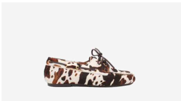
CUIR FAÇON POULAIN VACHE