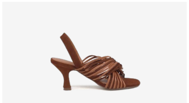
CUIR VELOURS COGNAC*