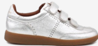
CUIR PAILLETÉ ARGENT