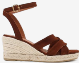
CUIR VELOURS COGNAC