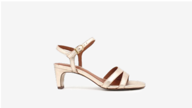
CUIR PAILLETÉ DORÉ CLAIR