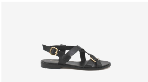
CUIR LISSE NOIR