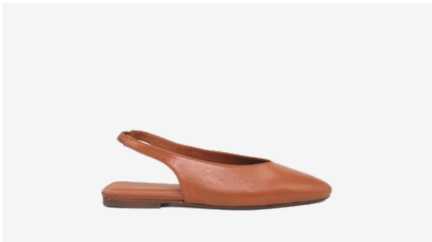
CUIR LISSE COGNAC