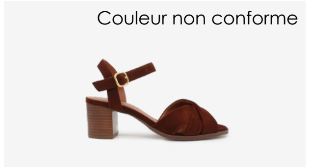
CUIR VELOURS COGNAC