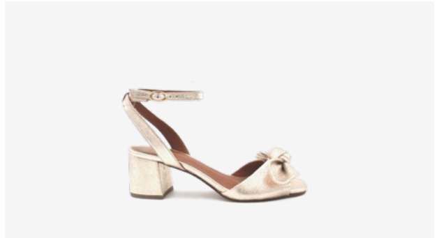
CUIR PAILLETÉ DORÉ CLAIR