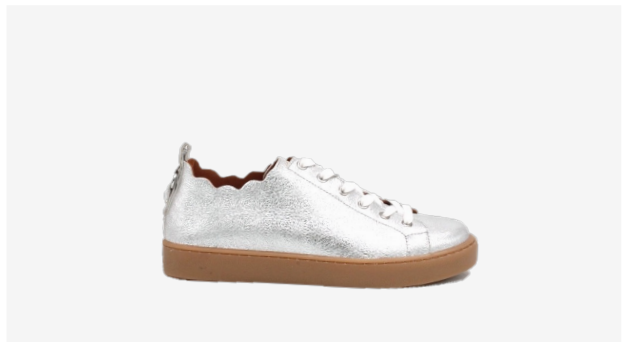
CUIR PAILLETÉ ARGENT