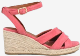
CUIR VELOURS ROSE