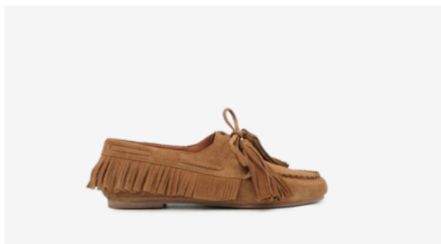
CUIR VELOURS CAMEL