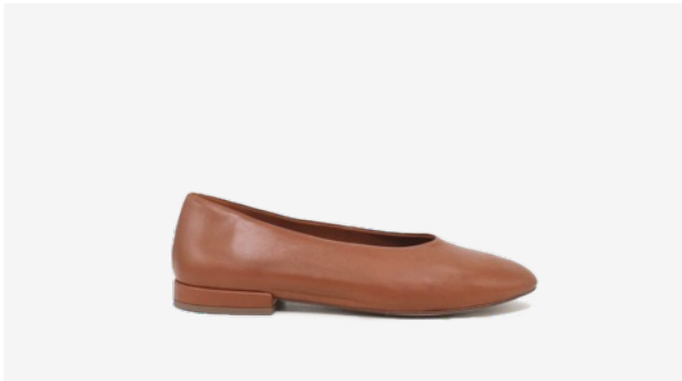
CUIR LISSE CAMEL