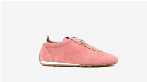
CUIR VELOURS ROSE