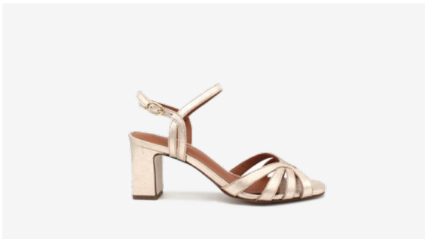
CUIR PAILLETÉ DORÉ CLAIR