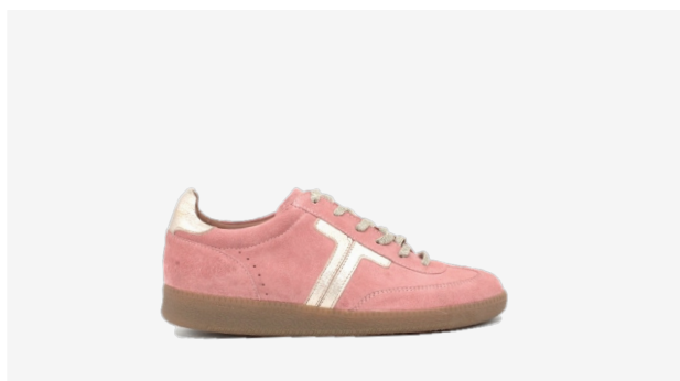
CUIR VELOURS ROSE / DORÉ