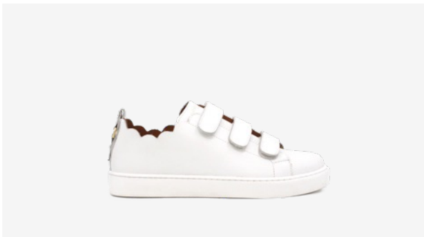
CUIR LISSE BLANC