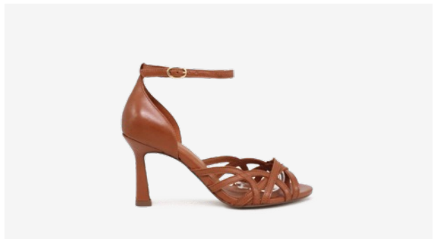
CUIR LISSE COGNAC*